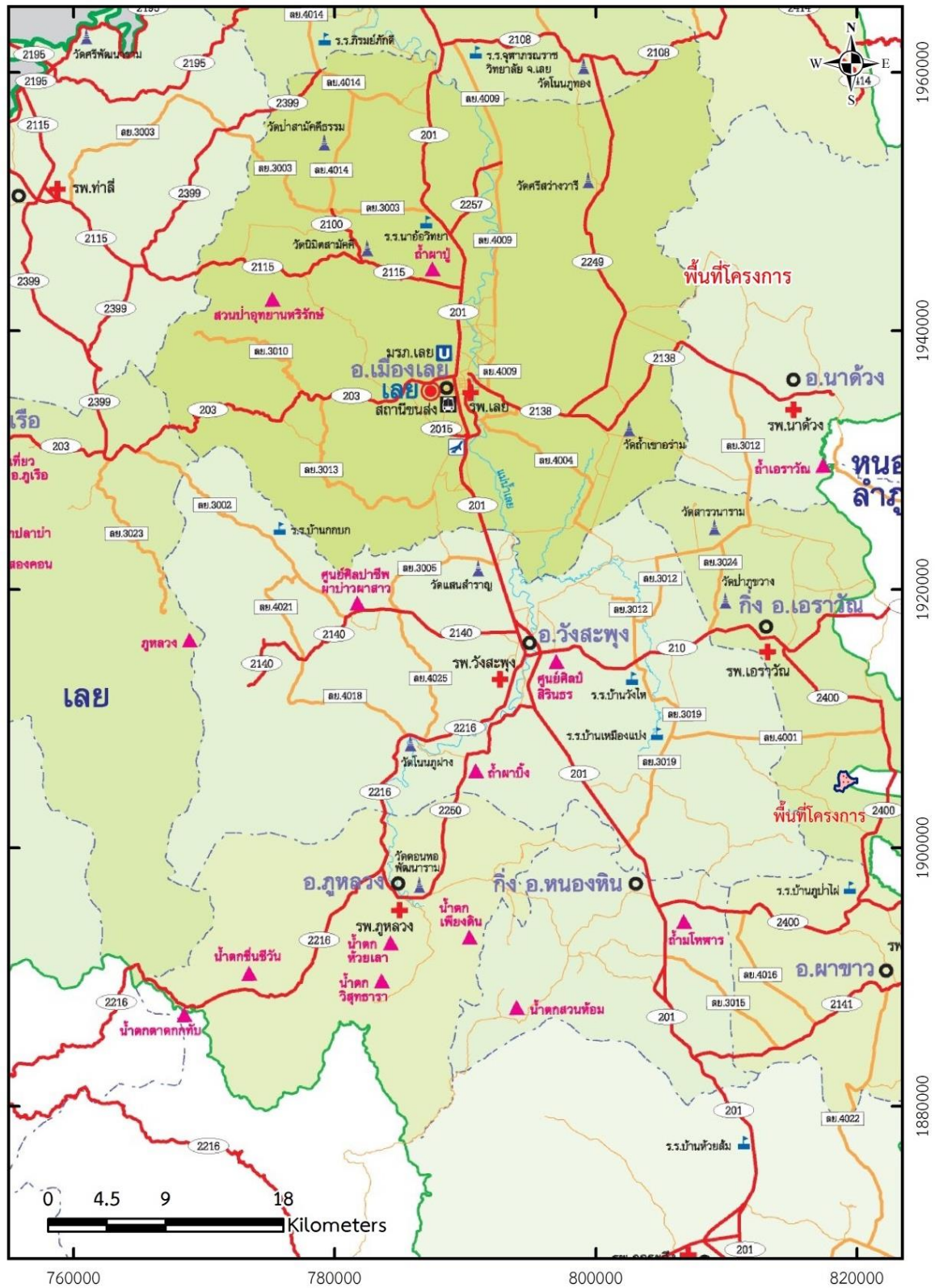
รูปที่ 1-2 เส้นทางคมนาคมเข้าสู่พื้นที่โครงการ