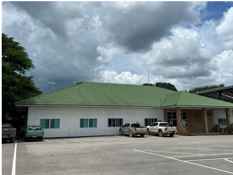
รูปที่ 1-7 อาคารสำนักงาน ที่ตั้งสำนักงาน บริษัท บำรุงเทพการศัลยา จำกัด