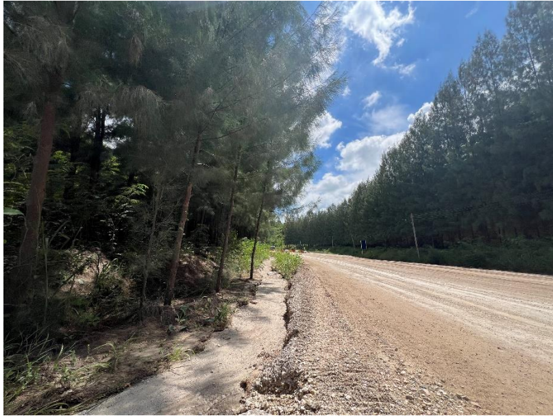
รูปที่ 1-6 ปลูกลำต้นสนประดิพัทธ์ เพื่อเป็นแนวป้องกันฝุ่น ตามขอบเขตของโครงการฯ