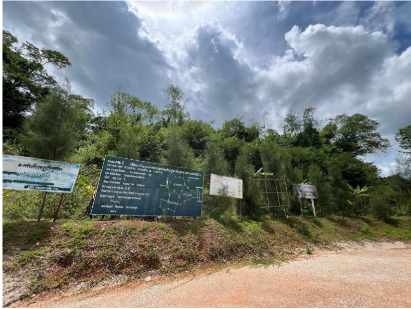
รูปที่ 1-8 ป้ายแสดงขอบเขตประทานบัตรที่ได้รับอนุญาต