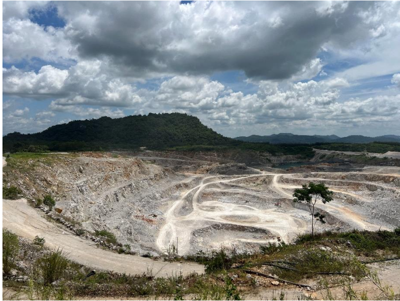
รูปที่ 1-10 หน้าเหมืองในปัจจุบัน ของโครงการฯ