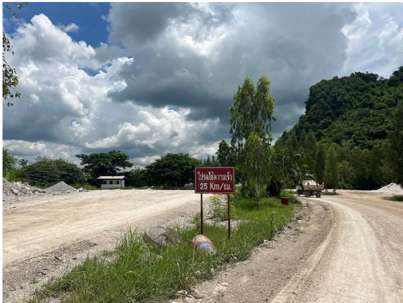
รูปที่ 1-11 เส้นทางขนส่งสินค้าภายในพื้นที่โครงการฯ