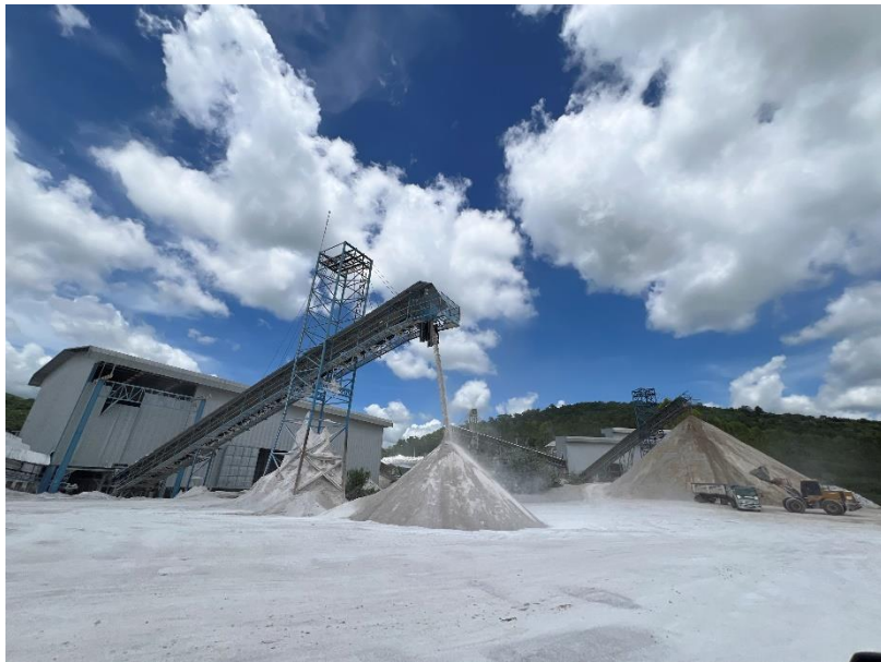
รูปที่ 1-9 โรงโม่ บดหรือย่อยหิน บริษัท บำรุงเทพการศิลา จำกัด